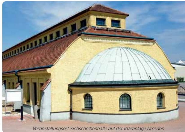
Veranstaltungsort Siebscheibenhalle auf der Kläranlage Dresden

Internet: www.stadtentwaesserung-dresden.de