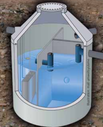
Illustration: mali umweltsysteme